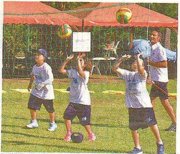
Bambini alle prese con una rete di pallavolo