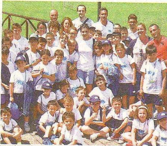
La campionessa di scherma Rosanna Gregorio insieme ai ragazzi di Educamp

«L'Educamp siamo noi - ha detto la Chiaese - e ho avuto tante conferme dalle testimonianze d'affetto dei bambini che hanno costretto i loro genitori a posticipare la partenza per le vacanze, pur di stare